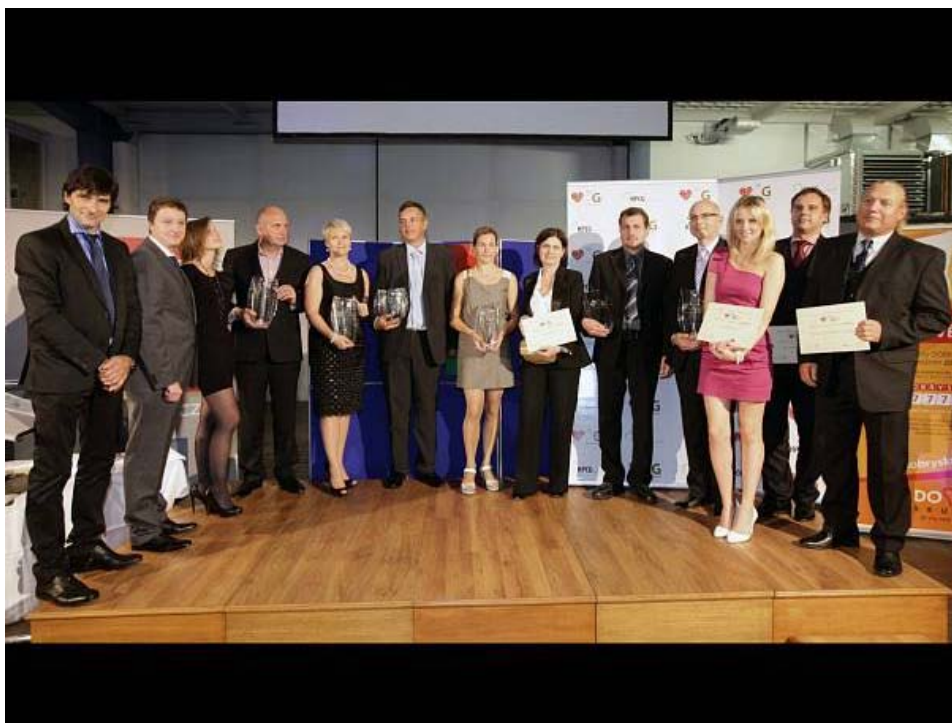
Vyhlášení loňského ročníku. Autor: Český Goodwill

Praha – Třetí ročník ocenění Český Goodwill, ocenění pro firmy, kterých si lidé váží, právě odstartoval. V úvodní fázi, která potrvá do konce června, mohou lidé zasílat své nominace podnikatelů a společností, které chtějí ocenit za jejich odpovědný přístup k podnikání, osobnostní kvality či etické jednání vůči nejširšímu okolí jejich firmy.